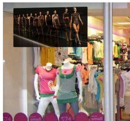
Lámina HOLO G.

Eventos / Escenografía, Exposiciones, Juegos, Cine en casa, Señalización digital interior, Museos, Señalización digital